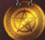
Photo non contractuelle – Le mage SOUYAAR est soumis à une obligation de moyens et non à une obligation de résultats. Mage Souyaar est une enseigne commerciale de la société PIJON ROYAL